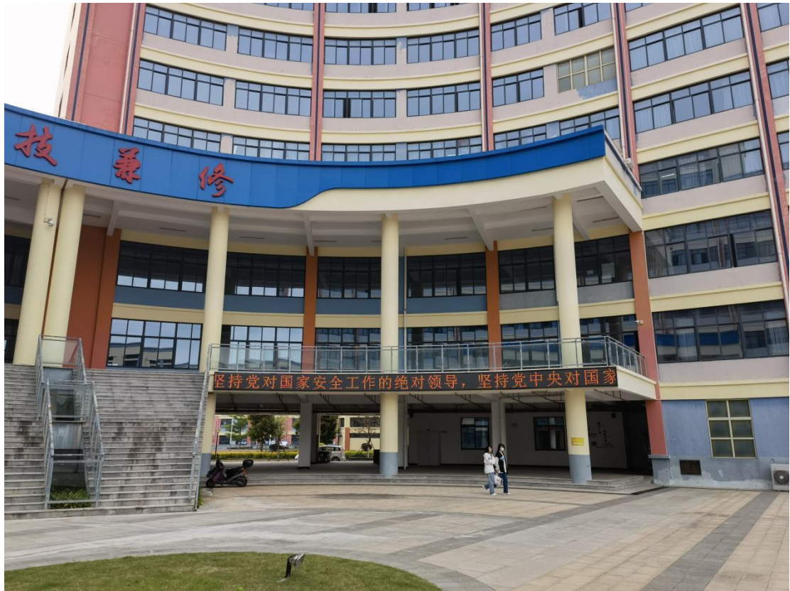
LED 电子显示屏宣传 1