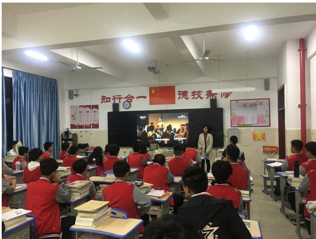
组织观看国家安全教育公开课 2