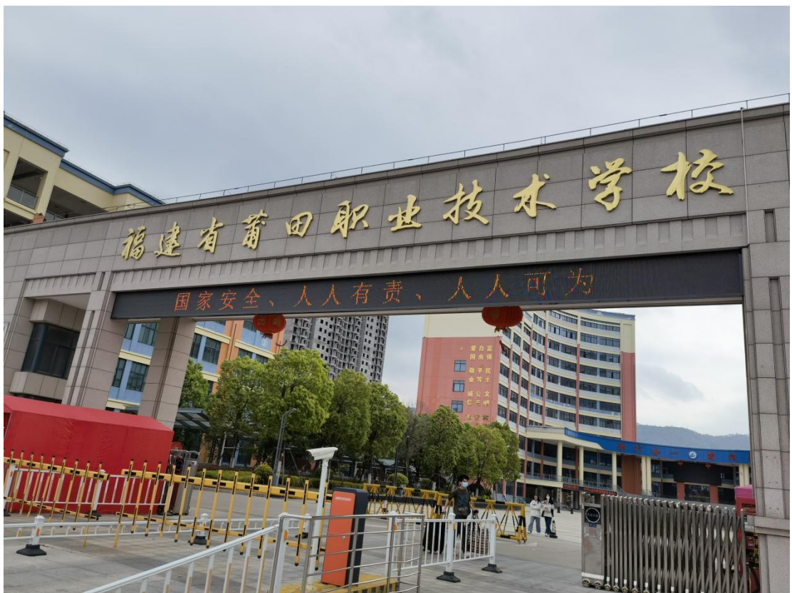
LED 电子显示屏宣传 2