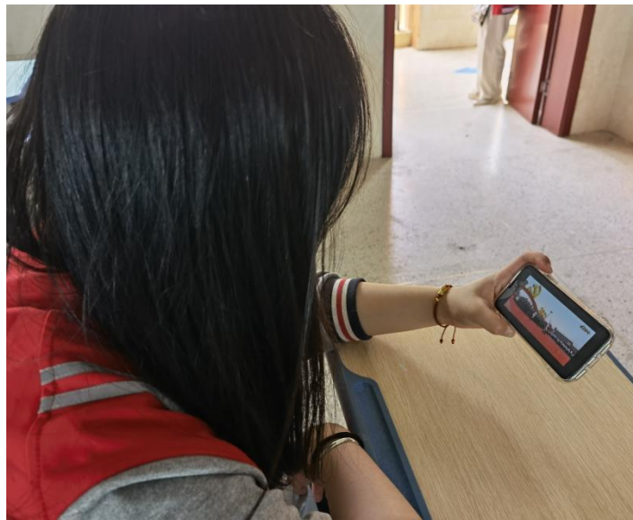
组织观看国家安全教育公开课 1